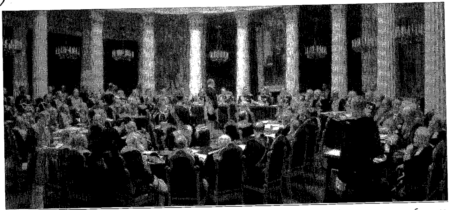
И.Е. Репин Торжественное заседание Государственного совета 7 мая 1901 года в день столетнего юбилея со дня его учреждения

V. Проанализируйте текст, содержащий историческую информацию и ответьте на следующие вопросы. Максимальное количество баллов за задание - 16 баллов.